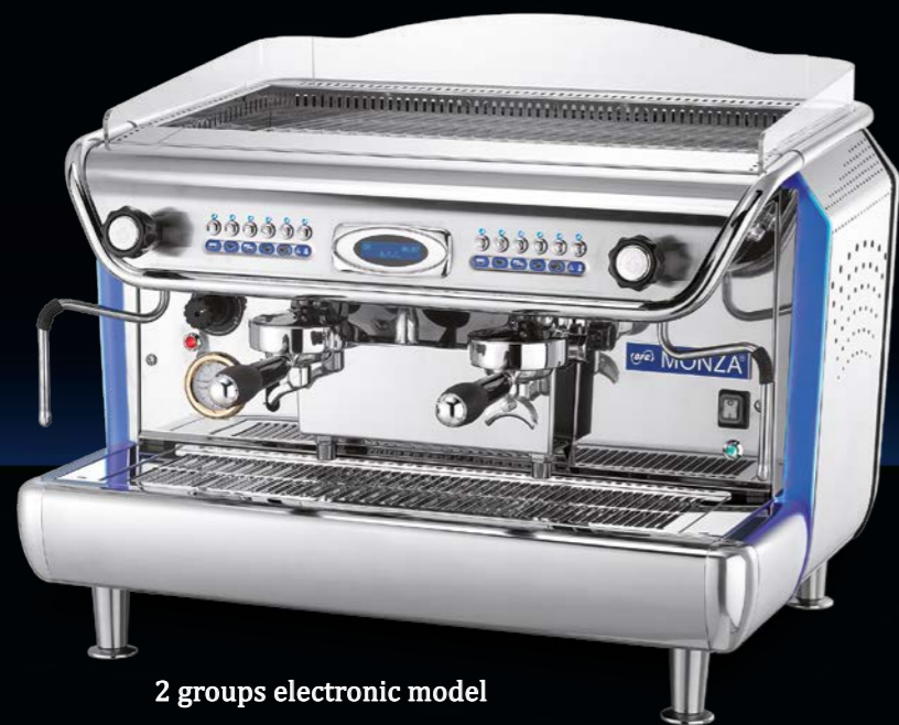
2 groups electronic model

Semi-automatica pulsante Semi-automatic switch model Halbautomatisch mit Drucktasten Semi-automatique a commutateur Semi-automatico a pulsador