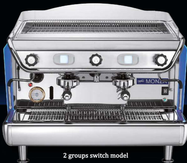
2 groups switch model