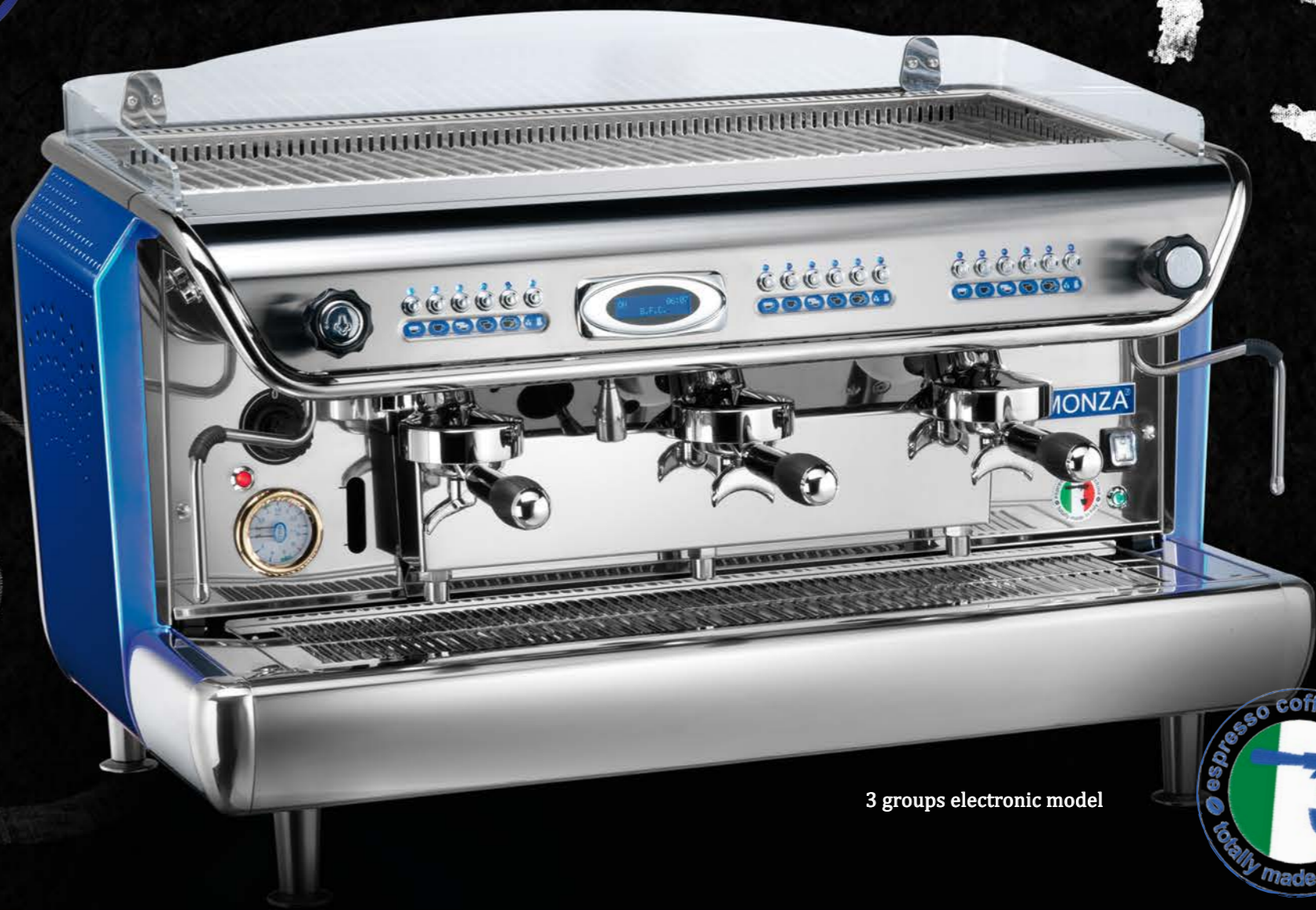
3 groups electronic model